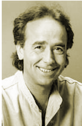
Joan Manuel Serrat