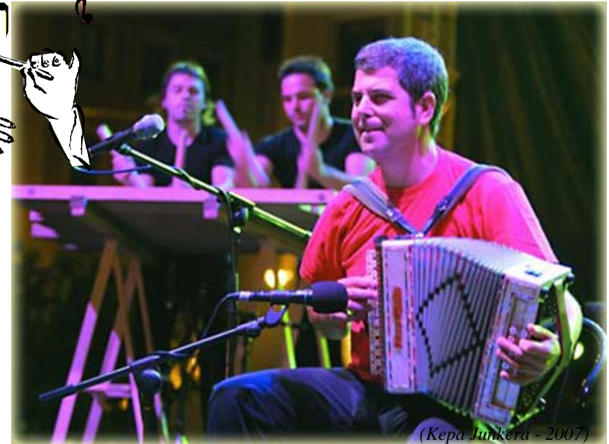
(Kepa Junkera - 2007)